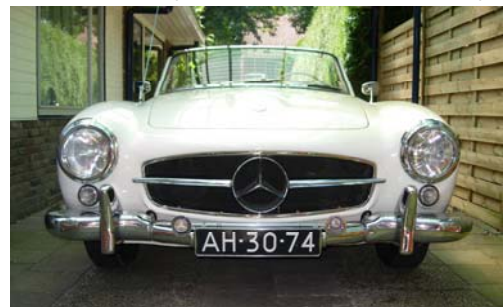
Foto 1: Clubschildjes gemonteerd en (onzichtbaar) steunen voor rallyschild.

oldtimers. Hoewel de tweede laklaag op mijn auto van bedenkelijke USA-kwaliteit is, zijn bijna alle behandelde deukjes als sneeuw voor de zon verdwenen. Hij stond er weer behoorlijk strak bij! Ik heb zelfs nog een constructie voor op de kentekenplaat gemaakt om het rallyschild nu eindelijk eens gemakkelijk de kunnen bevestigen (normaal gesproken een hele toer bij een 190SL), mét schildje van de Nederlandse Club.